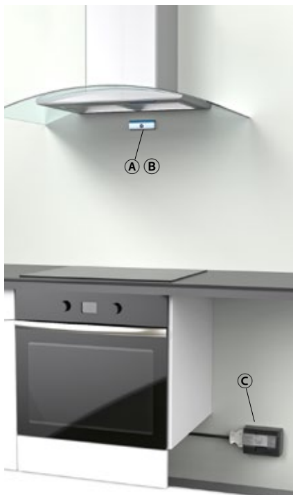
Monteringsbrakett Ⓑ med tape

Sensorenheten Ⓐ og strømstyringsenheten Ⓒ er koblet sammen ved hjelp av SA-FERA RobustLink trådløs forbindelse, som er konstruert for sikkerhetskritiske applikasjoner.