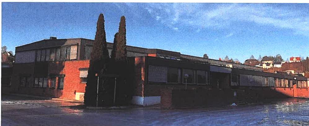
Figur 1 - Bilde av kontorlokaler i Ankersgate 12 som skal rives.

Rivingsarbeidene vil starte så fort som mulig i 2020.