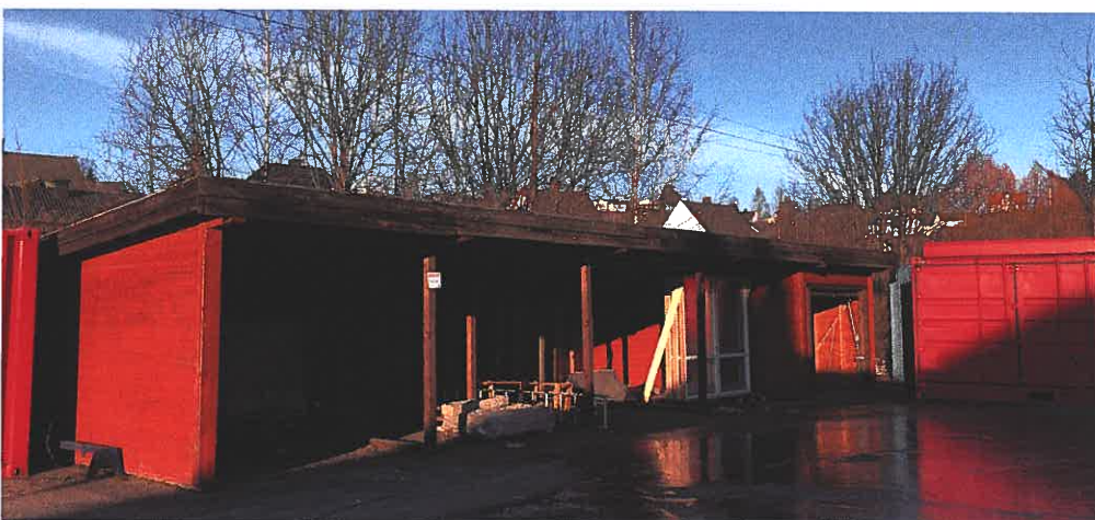
Figur 2- Bilde av garasjeuthus i Ankersgate 12 som skal rives.